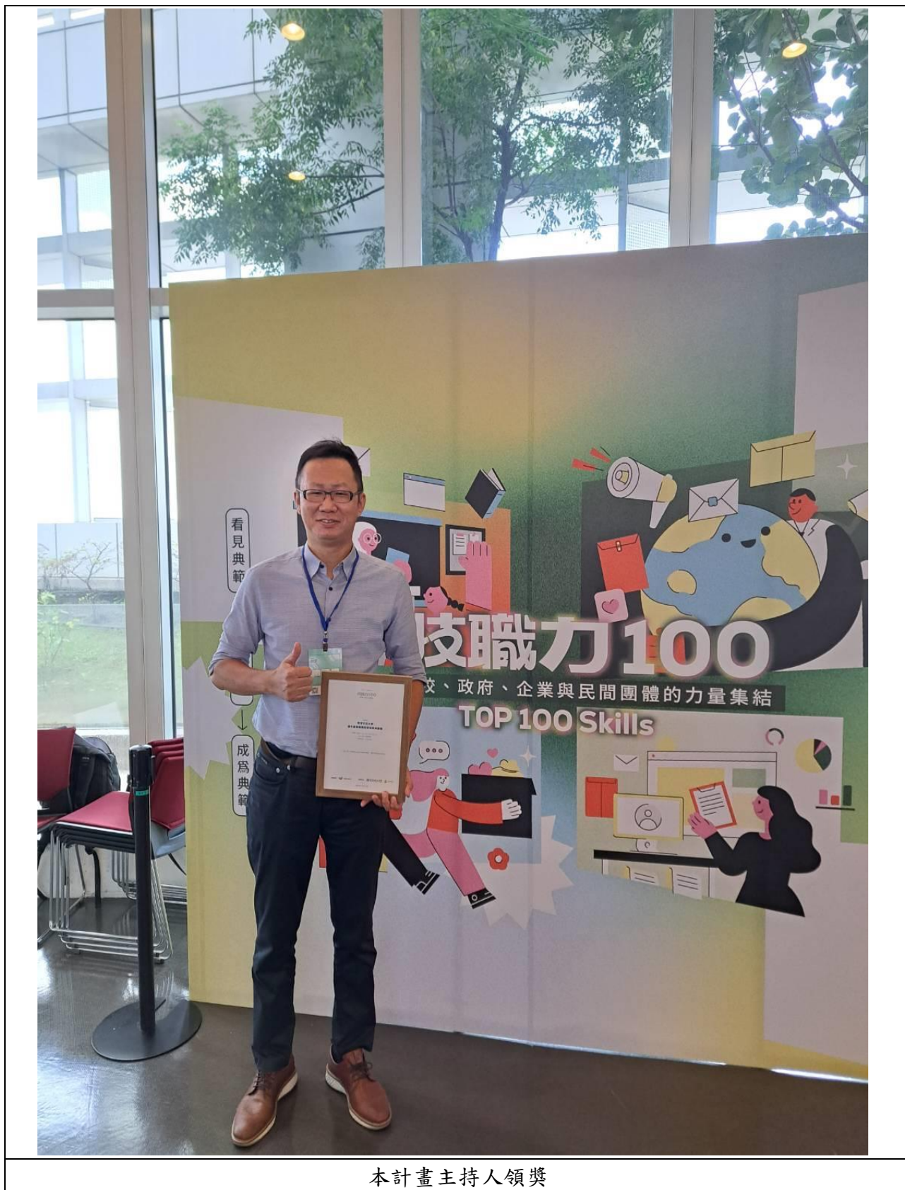
本計畫主持人領獎