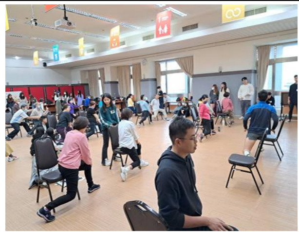
全班進行熱身動作