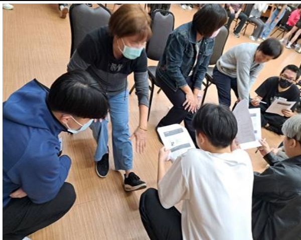
學生進行第一次體適能檢測引導