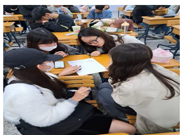
學生分組進行創意失能延緩動作設計