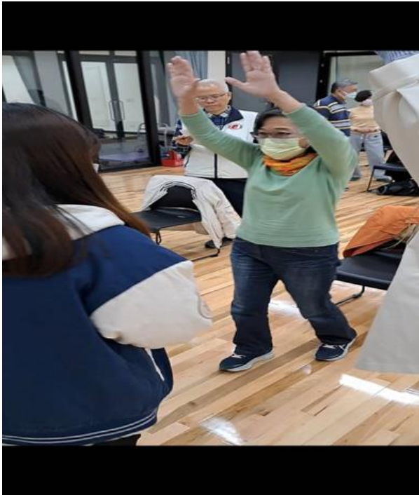
學生帶領銀髮族進行自己組別設計的方案