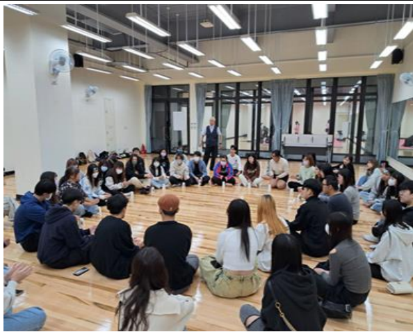
學生進行青銀溝通互動練習