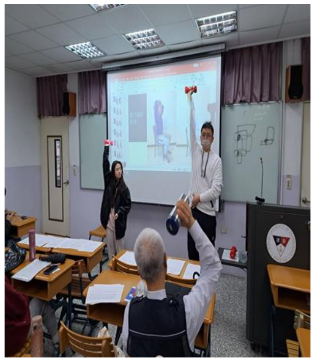
回教室後再次檢討、反思及修正方案