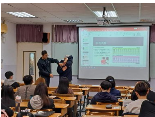
學生於教室進行第一次實作後的檢討反思