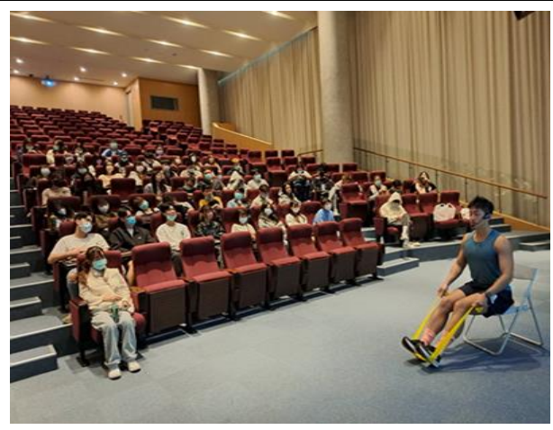
於三重醫院進行失能延緩討論及演練