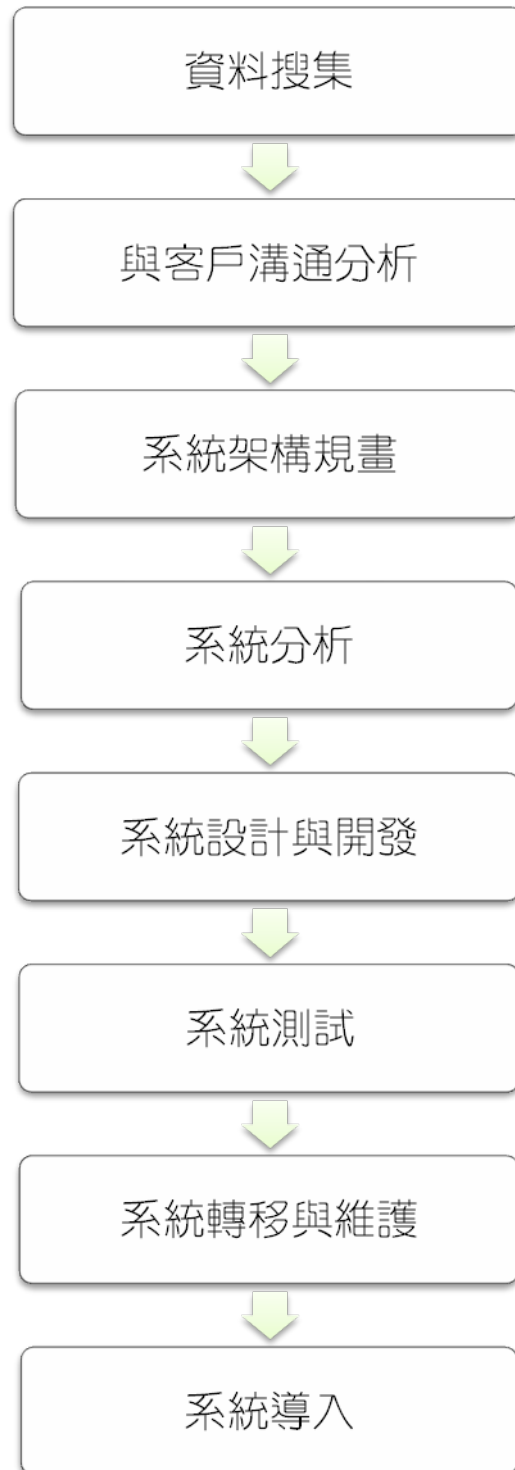
圖8 研究流程圖 3-1