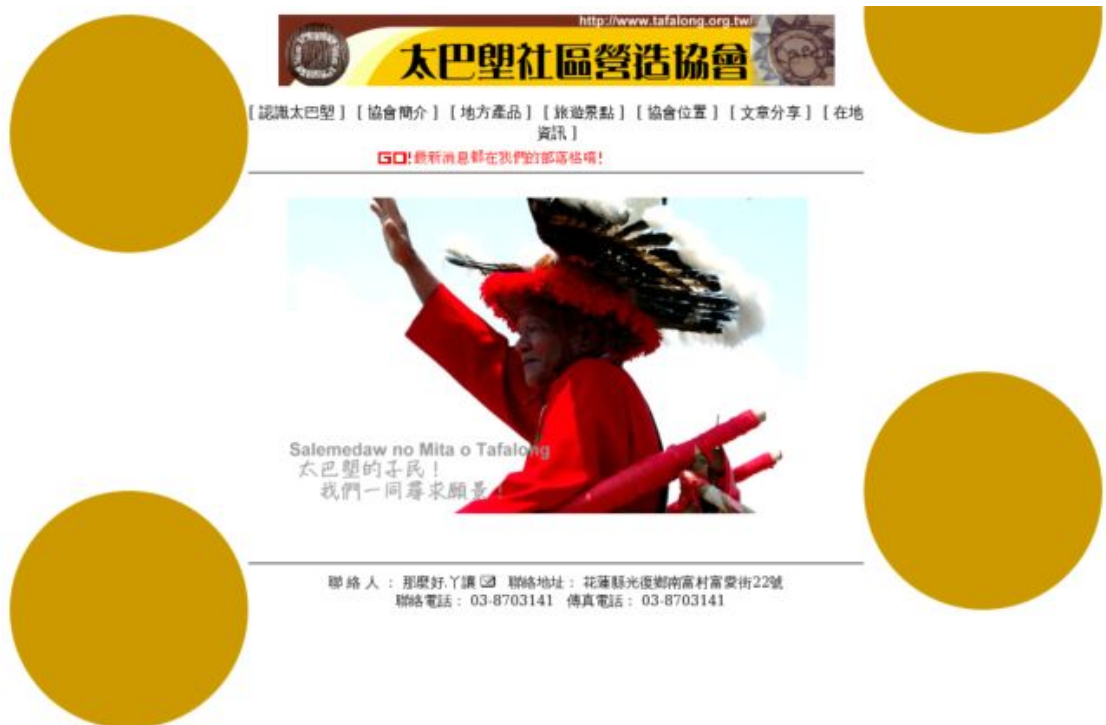
圖 7 現有網站參考圖 2-6(太巴壠營造協會網站)