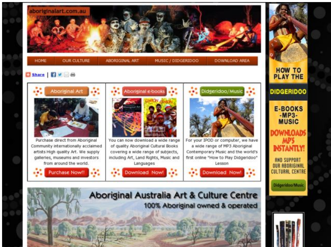
圖 4 現有網站參考圖 2-3 (澳洲土著文化)