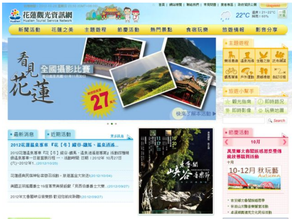
圖 2 現有網站參考圖 2-1(花蓮觀光資訊網)