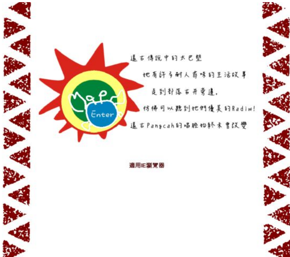
圖 6 現有網站參考圖 2-5(太巴壠營造協會網站)