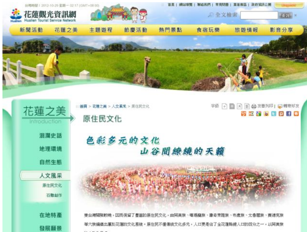
圖 3 現有網站參考圖 2-2(花蓮觀光資訊網)