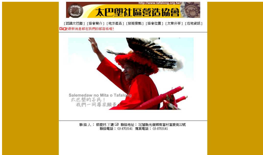
圖1 現有網站參考圖1-1(太巴壠社區營造協會原有網站)